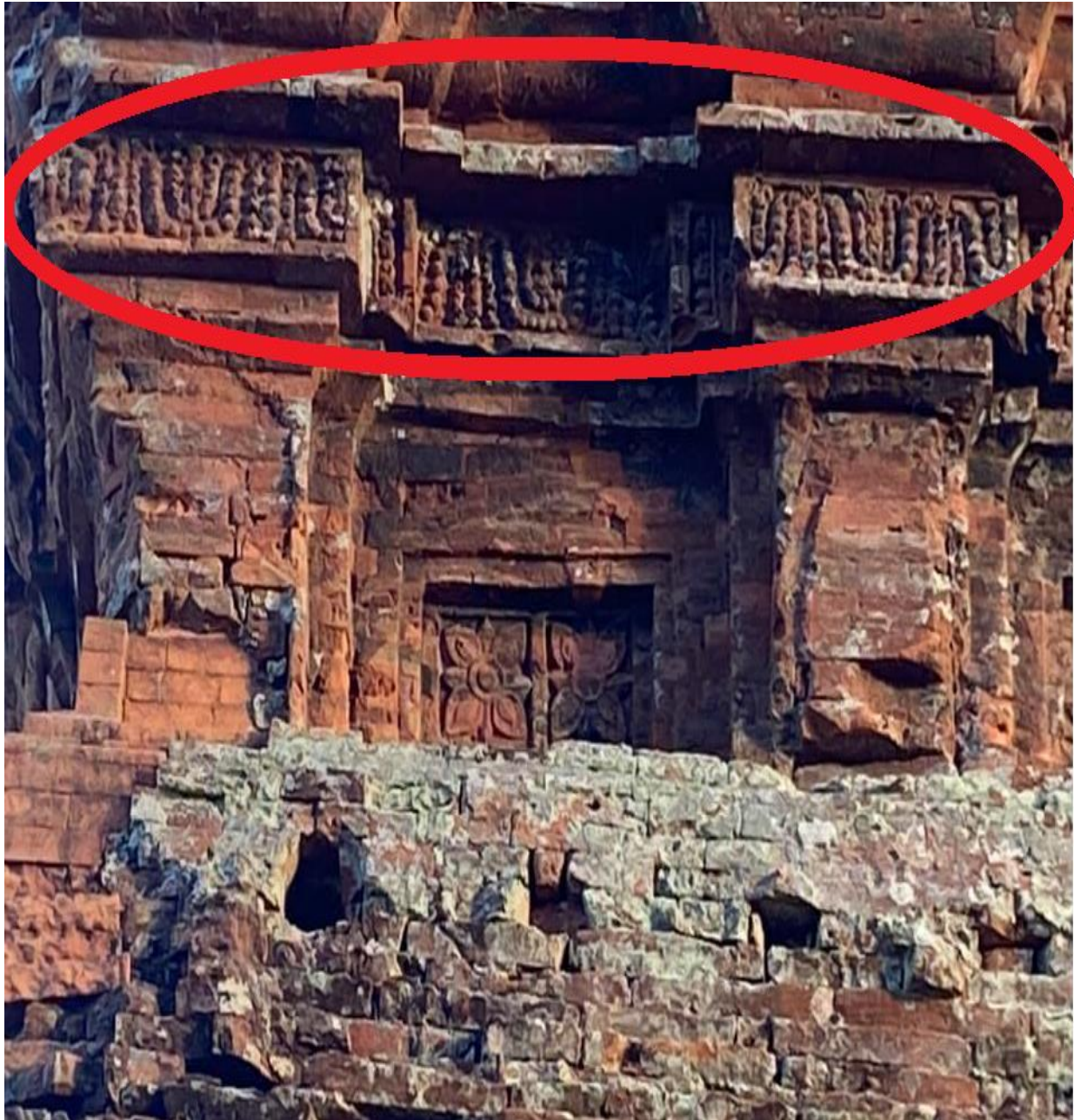
Kalan Yang Mtian - Tháp Lửa 5/2021.

Taksaka/thợ chạm khắc đá tạc tượng Kala tuốt trên cao gác đền, đuôi quần thành vòm cửa, có khi đầu một nơi đuôi một nẻo chạy quanh đền, chính là biểu tượng “thần thời gian Kala chạy vòng”, là vũ trụ mở ra theo mọi hướng, là vẻ đẹp và ý nghĩa của sự sống thiêng liêng.