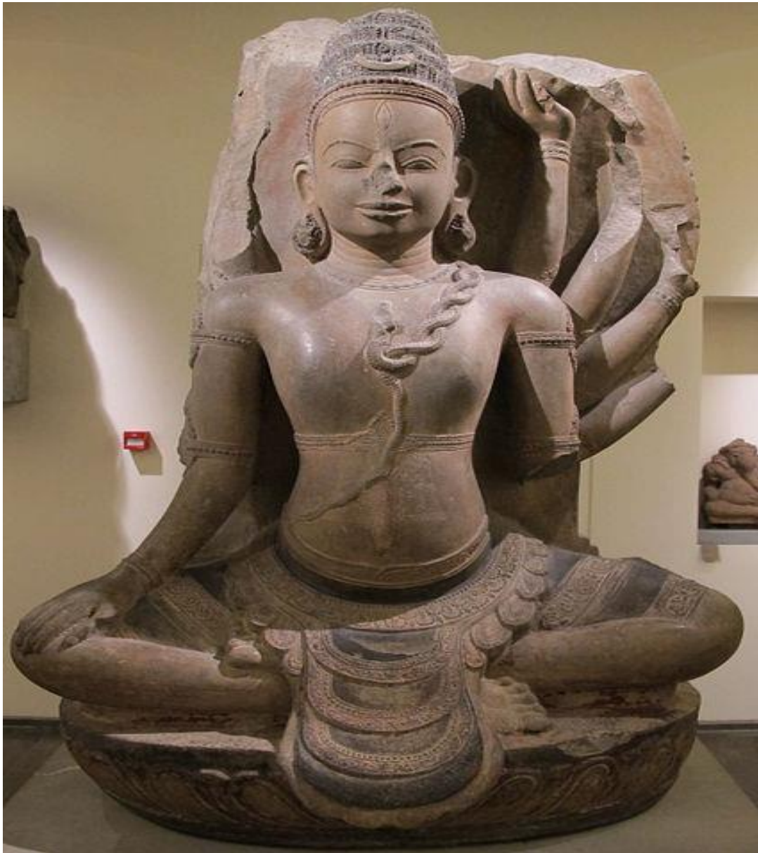
Thần Shiva, Art Cham -Musée Guimet-

Hồi nhỏ coi ciné rạp Thanh Vân đường Lê Văn Duyệt Saigon, chuyên chiếu phim Ấn Độ, Công Chúa Thủy Cung, Đất Rắn Nở Hoa Tinh, Thượng Khách Của Hoàng Cung... hoá phép ly kỳ làm bộ sợ nhảy ra khỏi ghế chui dưới gầm nên tôi nhớ nhiều truyền thuyết về con mắt thứ ba trên trán thần Shiva .