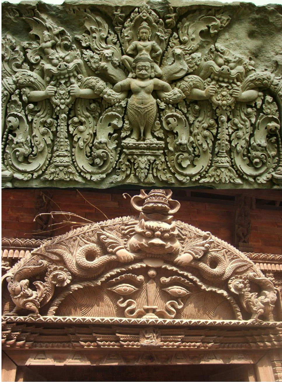
Siem Reap, kỷ IX, Linteau- Musée Guimet.

Kirtimukha theo tu sĩ thượng nhân thợ khéo Hindu qua Đông Nam Á được gọi là Kala vẫn giữ nguyên mặt tròn, mũi tròn, răng to, phồng má phun nước hay ngoạm đuôi mình. Bù lại nghệ sĩ ban cho Kala đuôi công đuôi ngỗng Hamsa tuyệt đẹp.