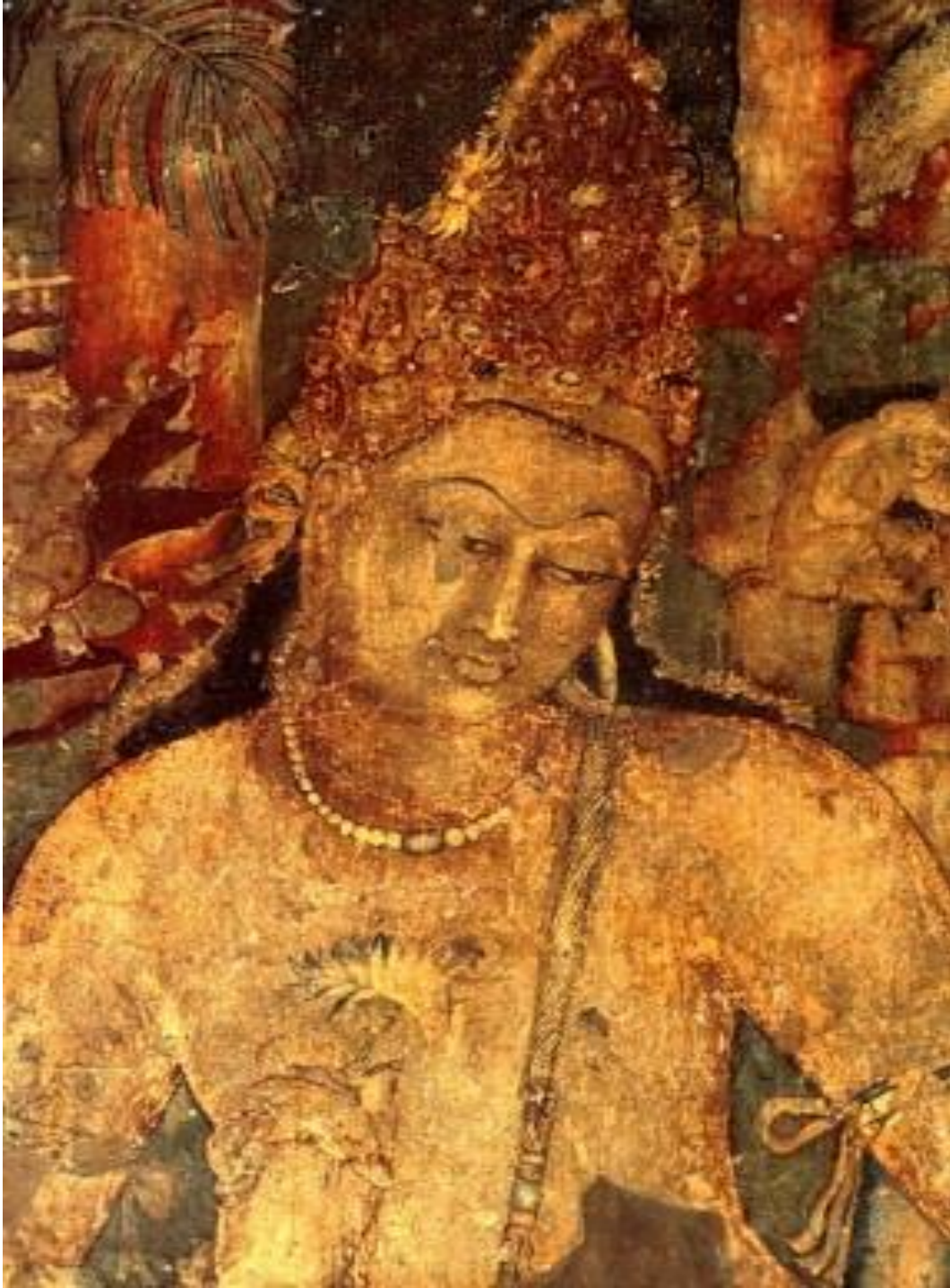
Bồ Tát Hoa Sen, kỷ 2TCN - Photo Benoy Behl, 1998 MET Museum https://www.metmuseum.org/art/collection/search/771375