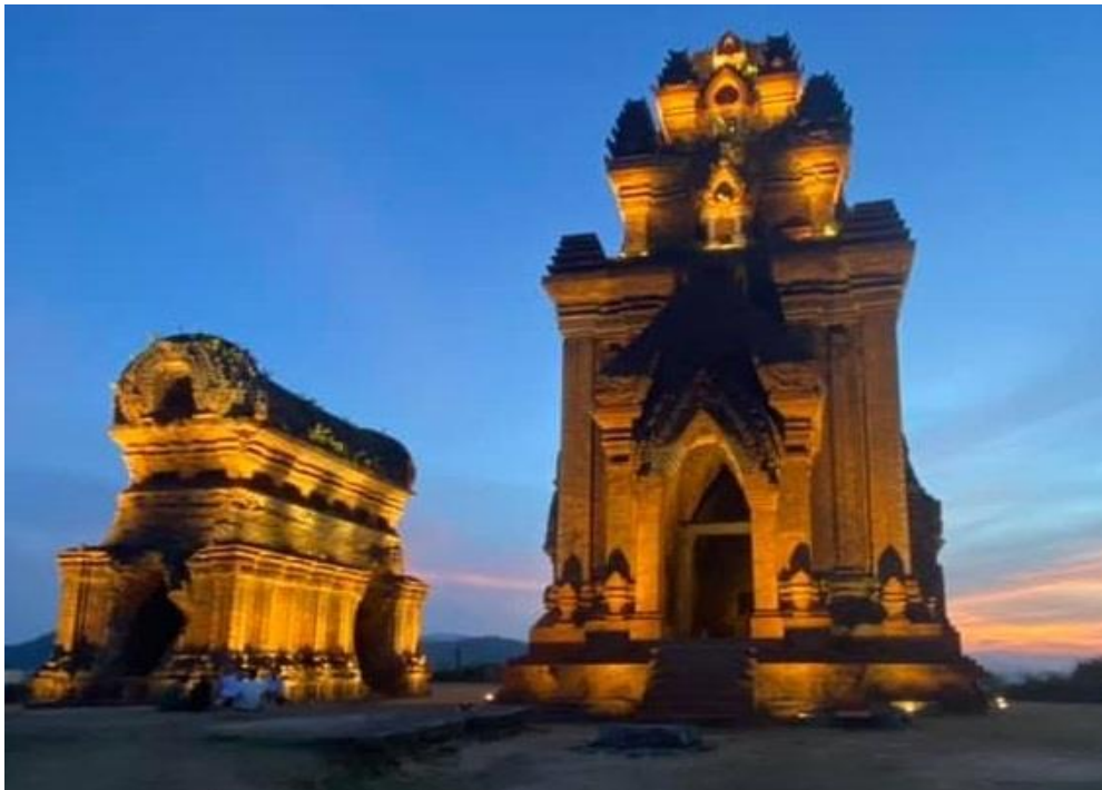
Kalan Yang Mtian –Tháp Lửa và Tháp Chính 22m

Thật bất ngờ, một ngày đẹp trời tháng Năm 2021, nhận được từ Teresa Phạm, trang Nghiên cứu Champa-Champa Studies, hình ảnh cụm Tháp Bạc thế kỷ 10, còn gọi là Tháp Bánh Ít, tiếng J'rai là Yang Mtian, thôn Đại Lộc, xã Phước Hiệp, huyện Tuy Phước, tỉnh Bình Định.