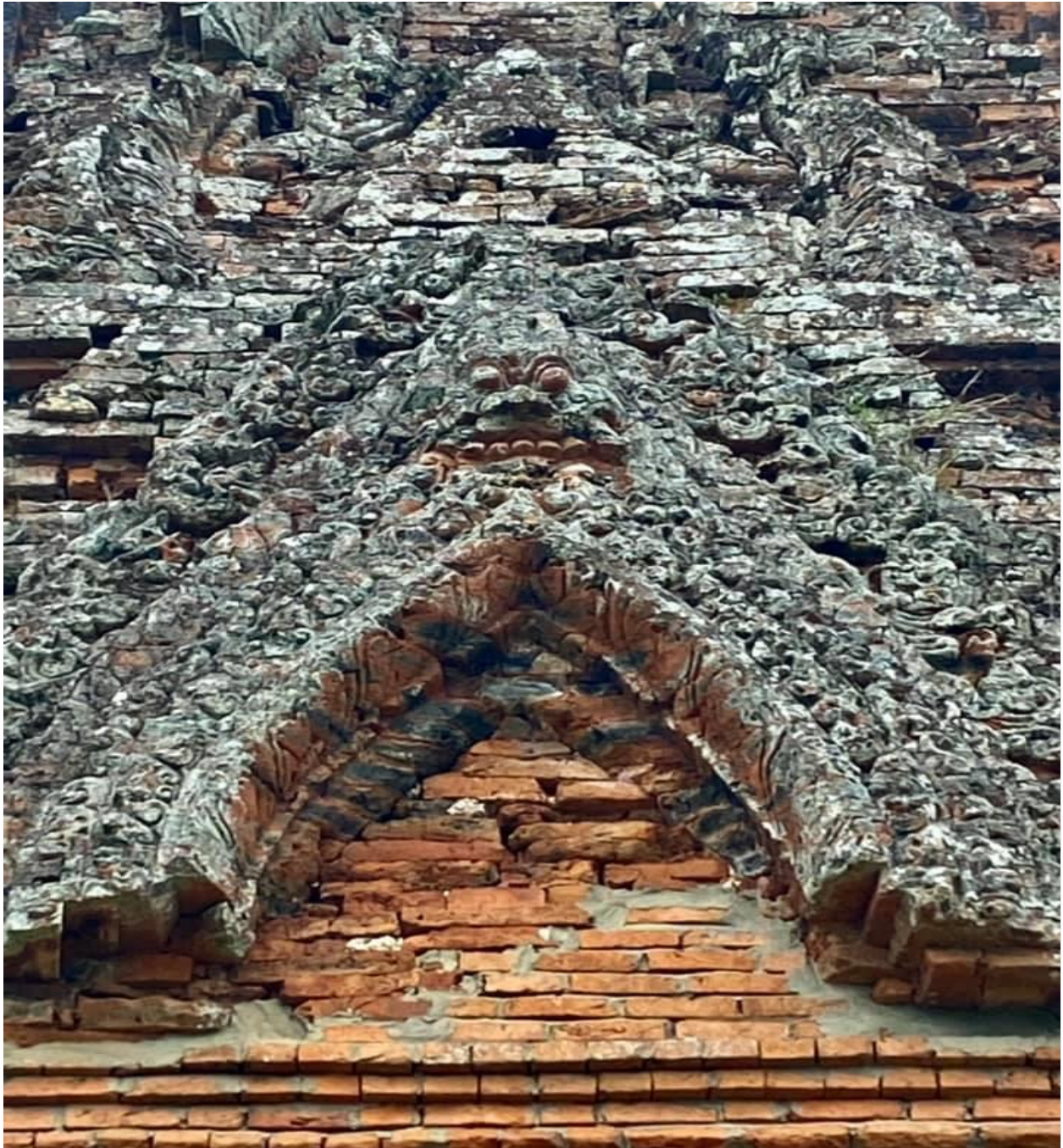
Kalan Yang Mtian – Tháp Chính - Photo Teresa 5/2021.

Theo sử thi Mahāpurāṇa Hindu, thần Shiva hoá phép biến con mắt thứ ba thành quái thú đi tiêu diệt vua Daitya. Trước khi lên đường chàng ta đói đòi ăn, nhìn quanh chẳng có gì thần bảo ăn tạm cái đuôi, chàng y lời quất một hơi chỉ còn lại mặt khiến thần Shiva hài lòng ban cho tên Kirtimukha tiếng Sankrit là “Mặt Chiến Thắng” cho gác cửa đền. Kirtimukha cũng chính là thần Shiva.