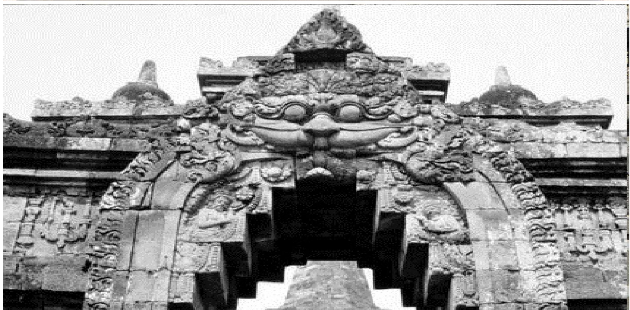
Công Đền Prambanan- Photo H. Bongers 2009

https://commons.wikimedia.org/wiki/File:COLLECTIE_TROPENMUSEUM_Poort_op_de_Borobudur_TM_nr_10015958.jpg